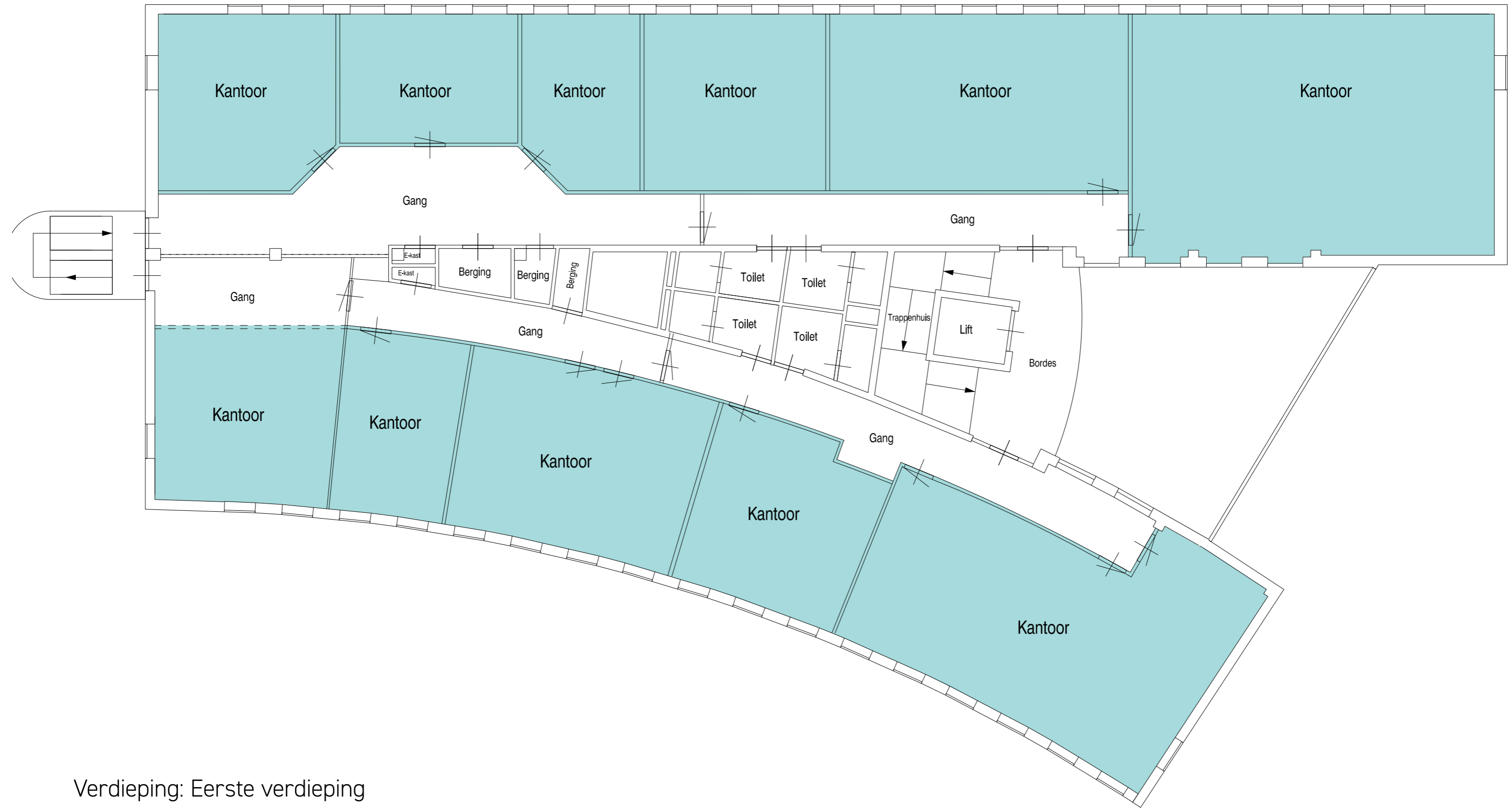
Verdieping: Eerste verdieping